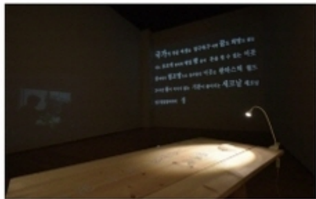
이승희 LEE Seunghee (1980 —)

풍경의 소리 + 터를 위한 눈 The sound of landscape + eye for field, 2019