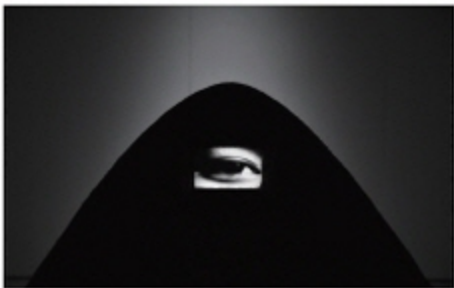
육근병 YOOK Keunbyung (1957 —)

풍경의 소리 + 터를 위한 눈 The sound of landscape + eye for field, 2019