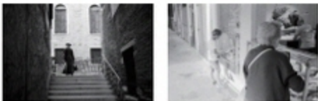
신승엽 SHIN Seungyeop (1984 —)

불편한 그러나 외면할 수 없는 Uncomfortable things which we cannot avoid, 2019