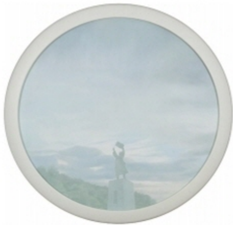
정치영 CHUNG Chiyung (1972 —)